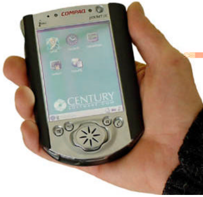
Gb1. Sebuah PDA