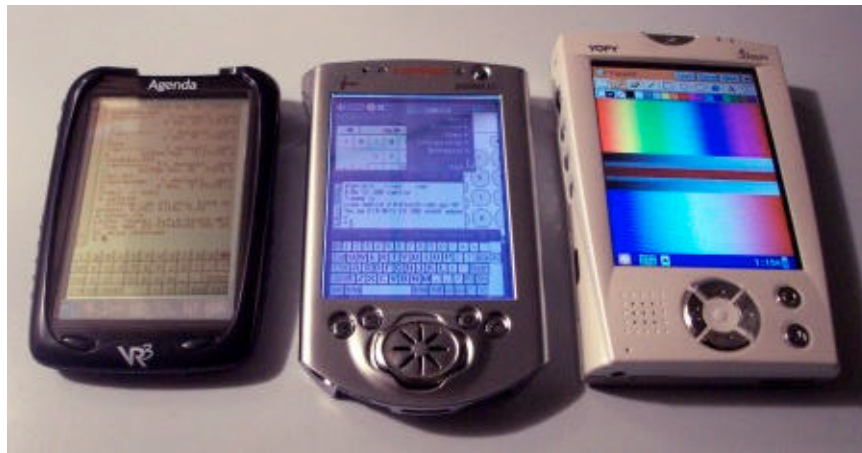
Gb.3 PDA berbasis Linux (Agenda VR3, Compaq iPAQ dan G. Mate Yopy)

Tapi telah ada beberapa tim yang telah berhasil membawa Linux agar dapat diimplementasikan pada PDA. Contohnya adalah project Linux VR untuk devais genggam MIPS dan Handhelds.org yang memfokuskan pada PDA berbasis processor ARM seperti Yopy dan Compaq iPAQ (tetapi pre-installed dengan Windows CE dan dapat ditulis ulang dengan Linux).